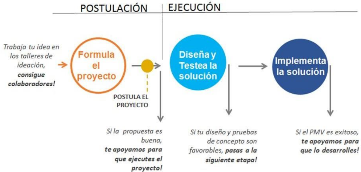
Cuadro 1. Elaboración propia